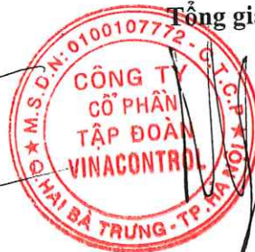
Mai Tiến Dũng